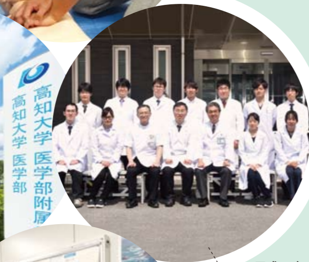
平成30年度採用研修医