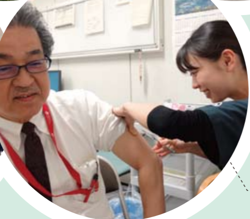
インフルエンザ予防接種